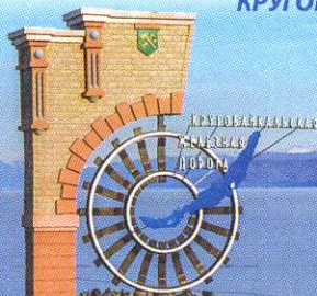
Памятная стела возле ж/д станции Култук